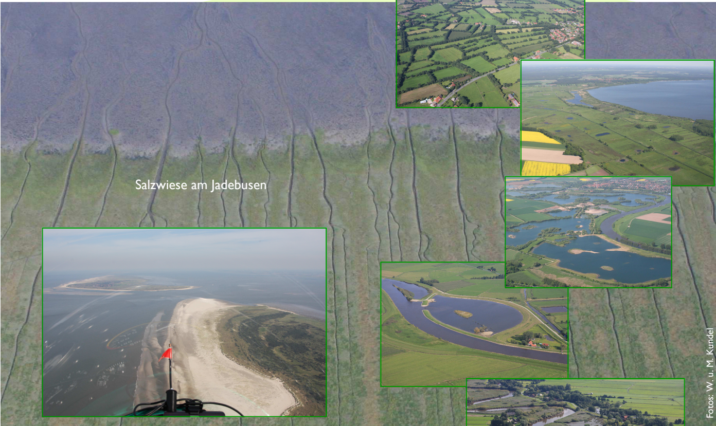
Salzwiese am Jadebusen