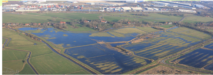
Aufgabenfelder Wasserwirtschaft und Umweltschutz